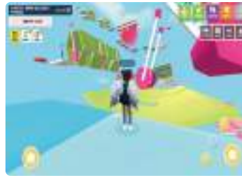
사이버스 활동 예시