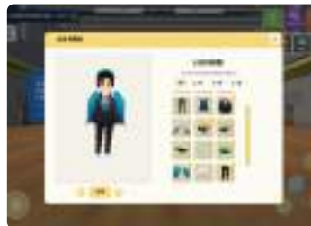
캐릭터 커스터마이징 기능

메타버스에서 친구들과 함께 사이버폭력 예방 방법과 대응 방법을 재미 있게 배울 수 있는 사이버스를 제공하고 있어요.